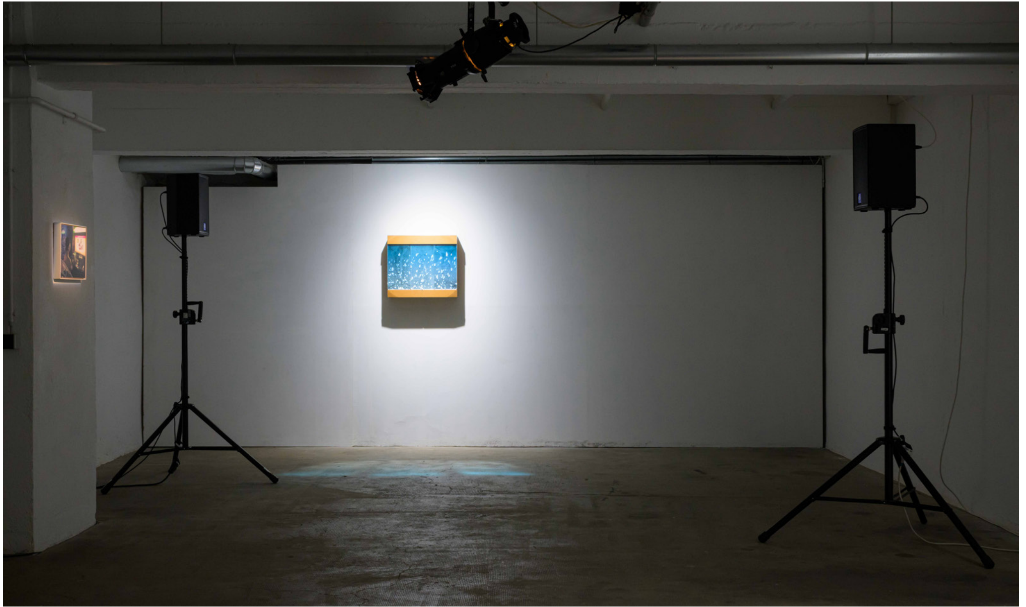
Thomas Liu Le Lann, Meaning of Love , 2022; Sweet Teeth #3 (Milo's Braces) , 2022, Installation View GG-EWERK