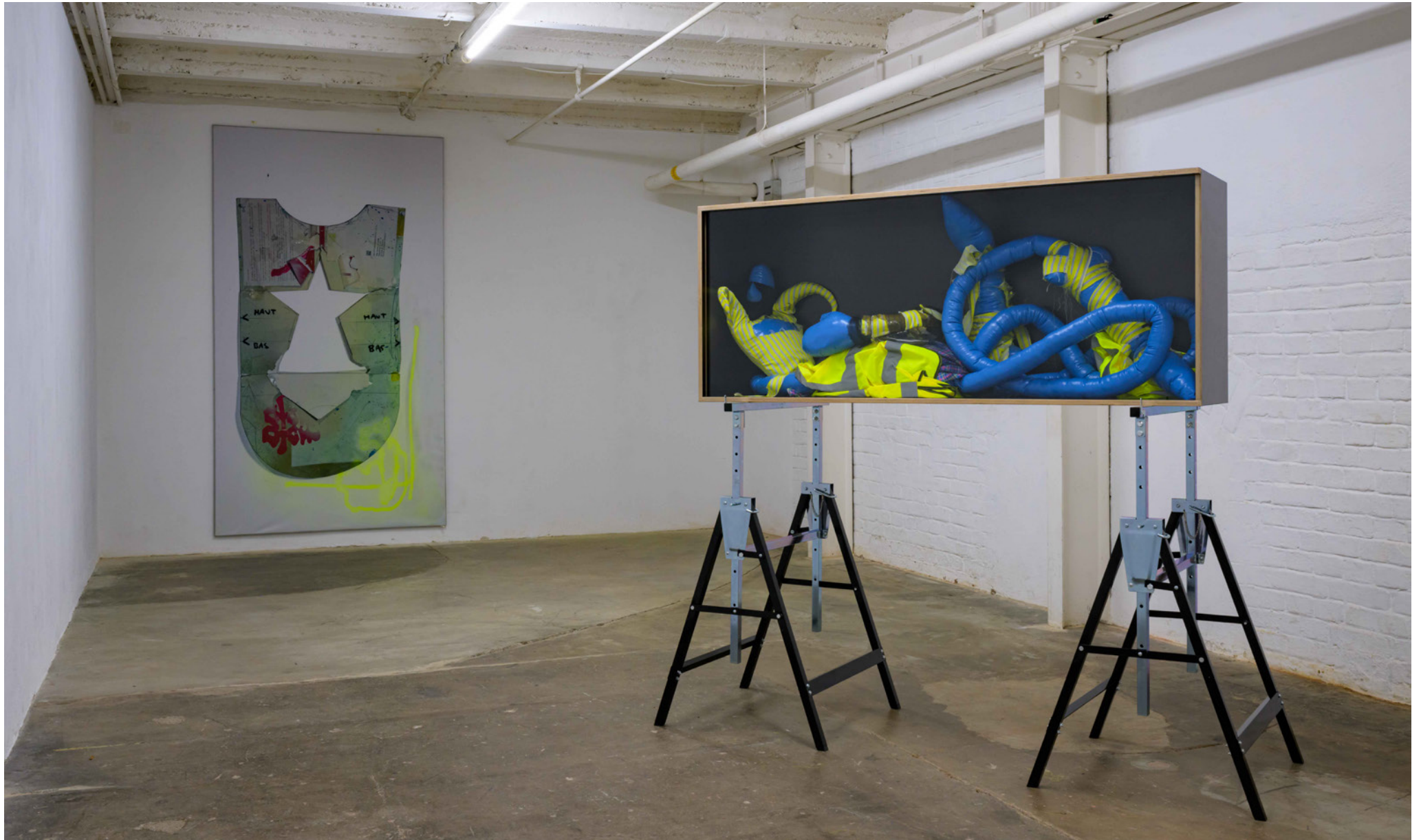
Thomas Liu Le Lann, Make sense of the world, destroy it , 2024; Lovers' Threadscape , 2024, Installation View GG-EWERK